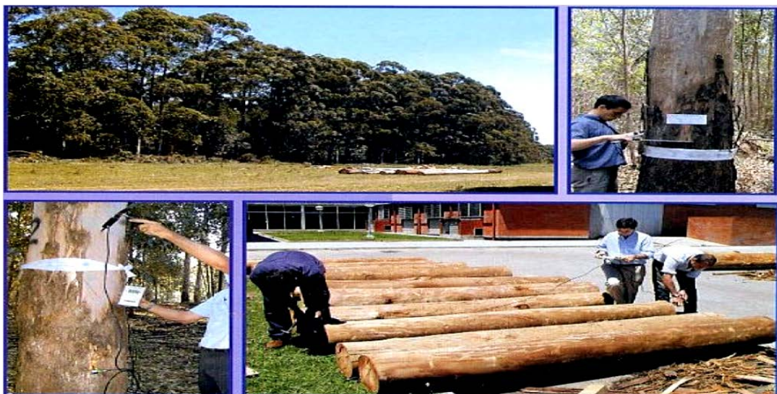
Caracterización madera, del bosque a la troza.

Los procesos de implementación de los proyectos de cooperación y estudios técnicos presentaron un proceso de implementación adecuado, sin mayores dificultades, que permitieron alcanzar los objetivos previstos. En general, los aspectos institucionales y sistemas de las organizaciones participantes no representaron limitantes para su ejecución. De hecho, hay una valoración generalizada de las modalidades de trabajo que permitían el trabajo conjunto entre expertos japoneses y nacionales (especialmente con los expertos de largo plazo).